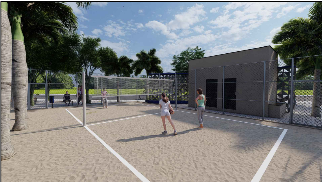
Vista Quadra Vôlei