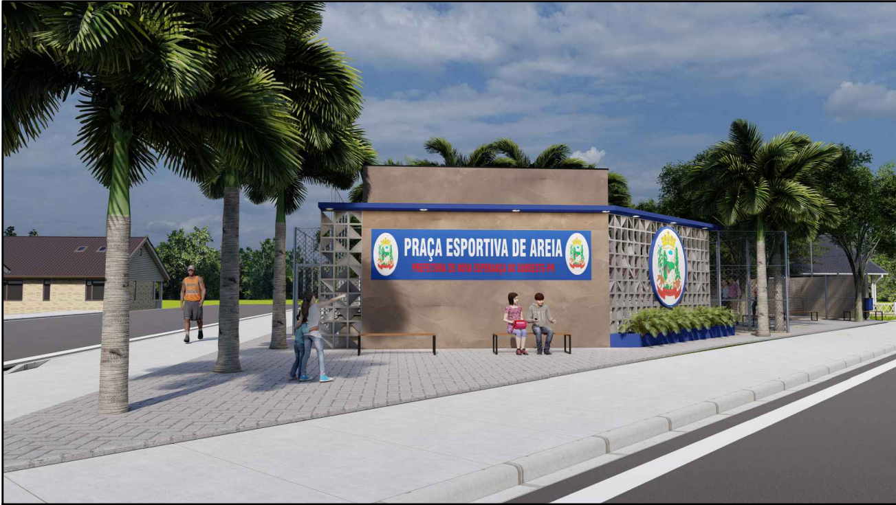
Vista Rua Jorge Engels