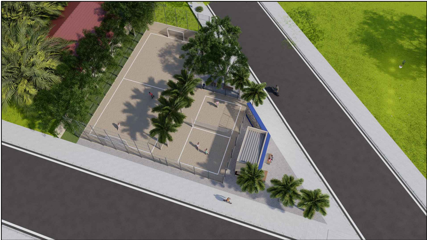
Vista Aérea Praça