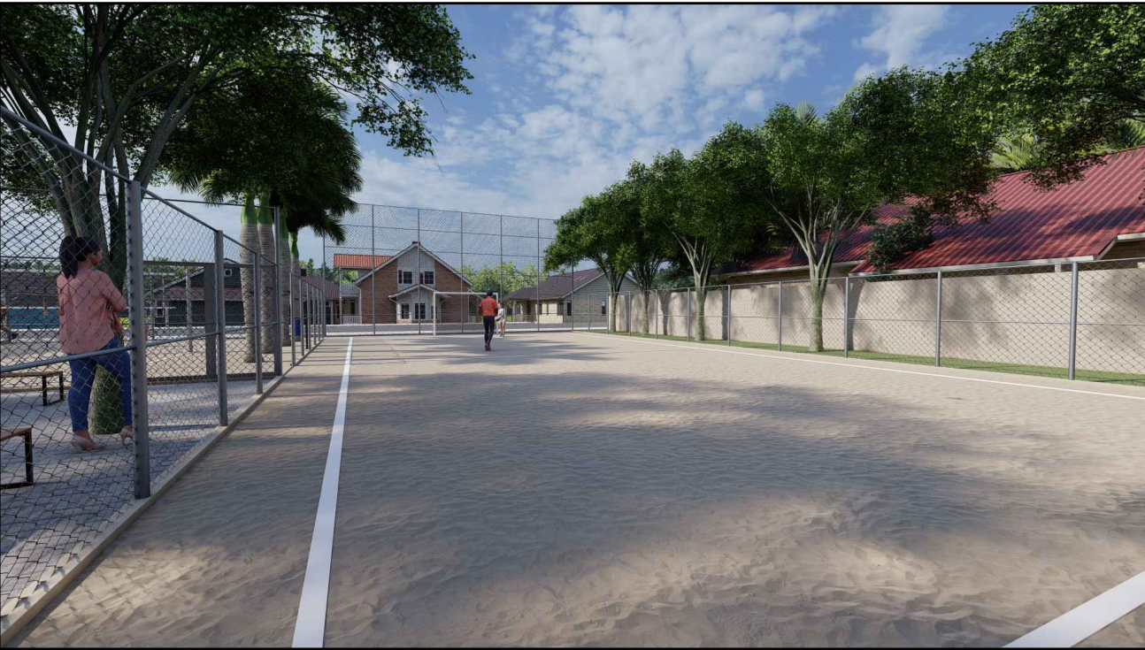
Vista Campo de Futebol