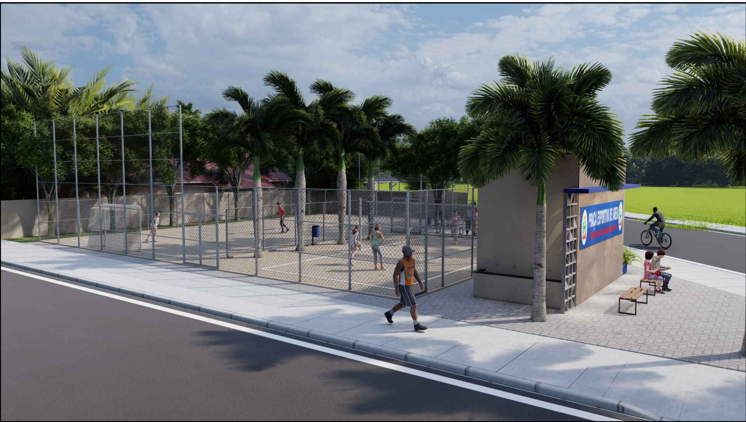
Vista Avenida Iguaçu